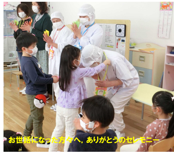
お世話になった方々へ、ありがとうのセレモニー