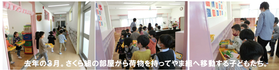
去年の3月。さくら組の部屋から荷物を持ってやま組へ移動する子どもたち。

子育ては大変ですが、かけた時間や手間は無駄ではなく、必ず返ってきます。それはすぐ目に見えるものではなく、数年後かもしれ