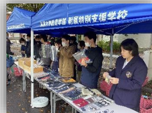
R5年度の販売の様子

今年も10月18日（金）13:00～15:00、弘大祭で生徒たちが作業学習で作った製品を、生徒たちが販売します。去年は雨天にもかかわらず、ほぼ完売いたしました。ありがとうございました。今年もすてきな製品がそろっています。ご都合のつく方はぜひ、足を運んでいただけたらうれしいです。よろしくお願いします。（中学部一同）