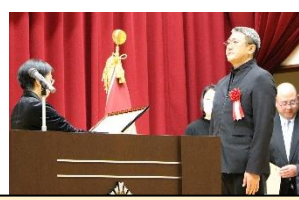
歴代父母の会会長表彰