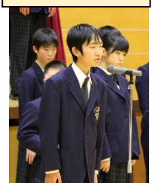
ありがとうございました