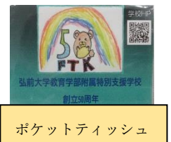
ポケットティッシュ