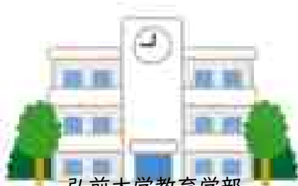
弘前大学教育学部 附属特別支援学校